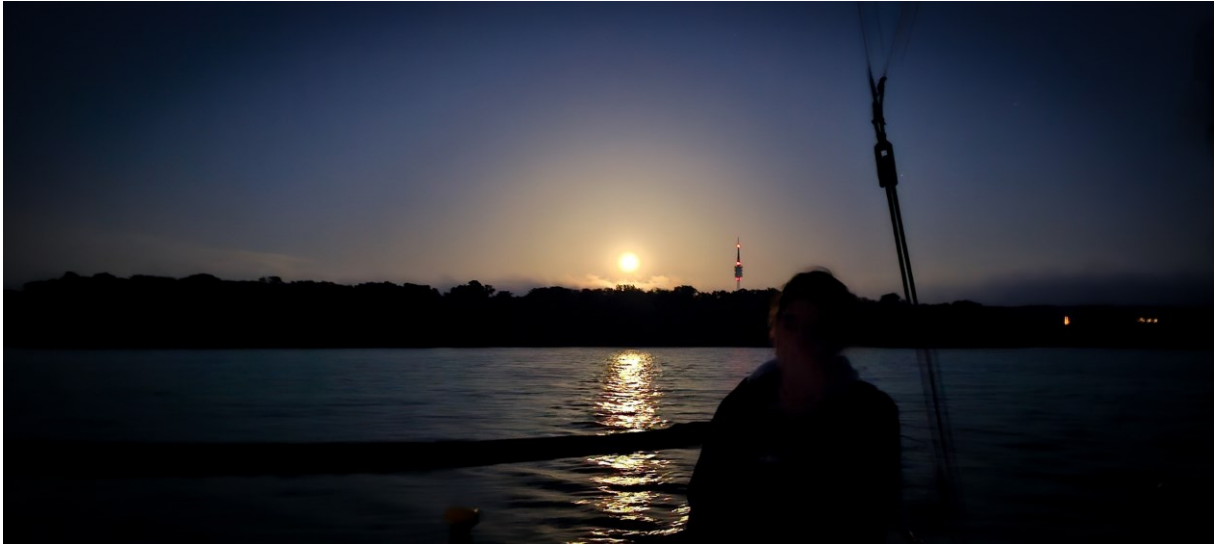
60 Seemeilen auf X-99 Xenia (BYC), vom Jungfernsee zurück in den Wannsee

Die 60 Seemeilen im Jahr 2024 waren schönsten Segeln bei Mondschein und meist 2-3 Bft. Die Wettfahrtleitung ging souverän mit den Unwetterwarnungen um, verschob den Start zweimal und verkürzte die Bahn etwas (bzw. für Gruppe B sehr). Dadurch erlebten wir bis auf einen Schauer herrliches Segeln bei Fast-Vollmond und Sternenhimmel in warmer Sommernacht.