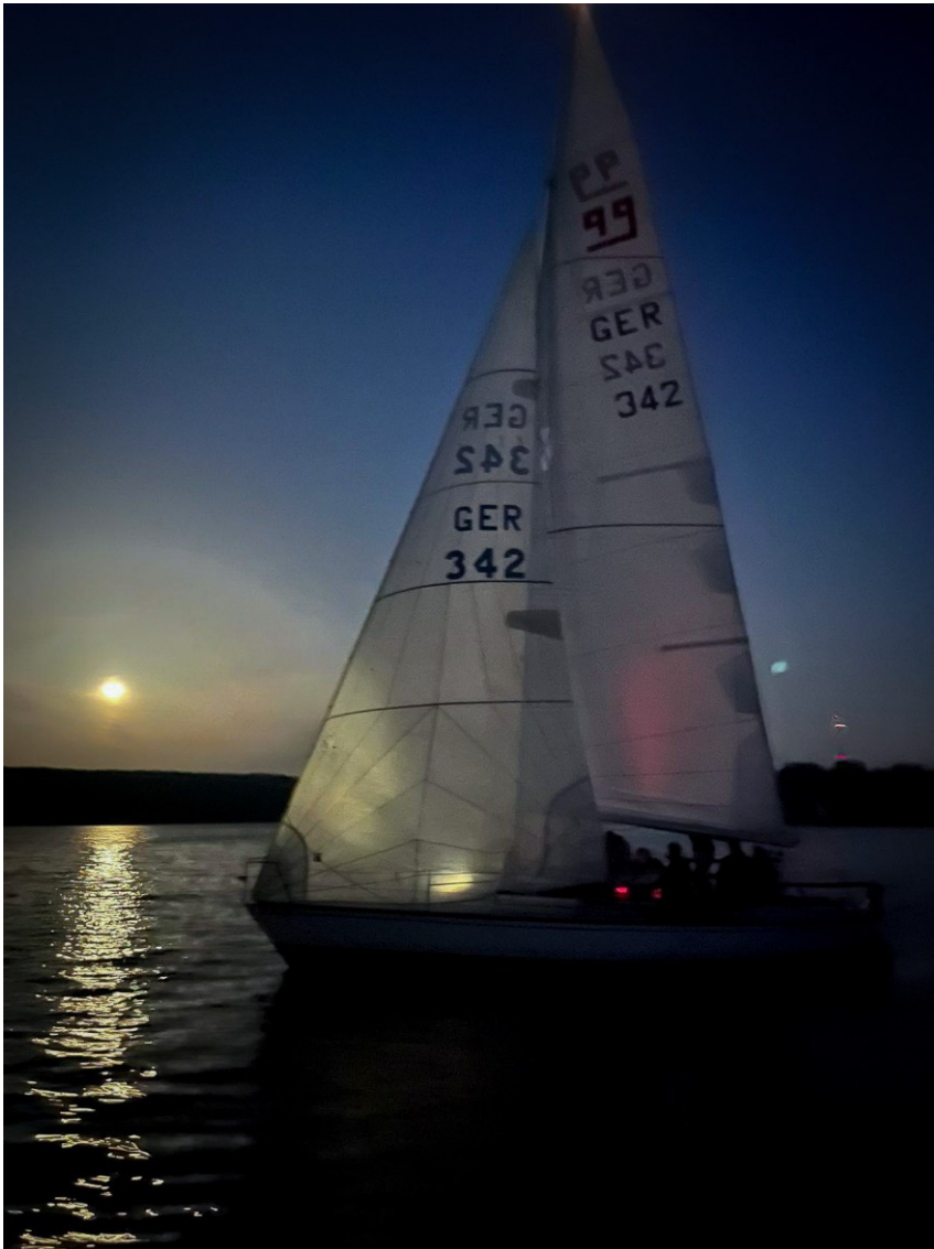
60 Seemeilen 2024, X-99 Xenia (BYC) auf dem Weg vom Jungfernsee in den Wannsee

Das Segeln selbst machte auf der X-99 wieder großen Spaß. Der Druck reichte und das Schiff lief mit Genua und Groß flüsternd über das flache Wasser. Nur in der ersten großen Runde Wannsee-Scharfe Lanke-Jungfernsee-Wannsee waren die schmale Stelle bei Gatow für uns bei SE mit drehenden Winden und Windlöchern in der Abdeckung eine Herausforderung. Im Anschluss an die große Runde ging es zweimal vom Wannsee nach Lindwerder und zurück zum PYC, das war jeweils schönes Spinnakerfahren und eine gute Kreuz. Um 3 Uhr 50 kam schließlich der Eintrag im Logbuch „Schiff fest“.