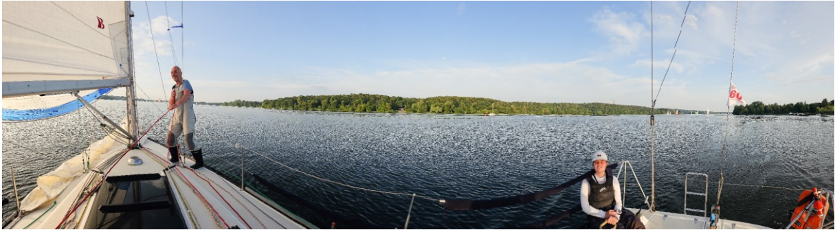
60 Seemeilen 2024, X-99 Xenia (BYC), Spinnakerzauber bei schwachen, drehenden Winden vor Gatow

Das Segeln selbst machte auf der X-99 wieder großen Spaß. Der Druck reichte und das Schiff lief mit Genua und Groß flüsternd über das flache Wasser. Nur in der ersten großen Runde Wannsee-Scharfe Lanke-Jungfernsee-Wannsee waren die schmale Stelle bei Gatow für uns bei SE mit drehenden Winden und Windlöchern in der Abdeckung eine Herausforderung. Im Anschluss an die große Runde ging es zweimal vom Wannsee nach Lindwerder und zurück zum PYC, das war jeweils schönes Spinnakerfahren und eine gute Kreuz. Um 3 Uhr 50 kam schließlich der Eintrag im Logbuch „Schiff fest“.